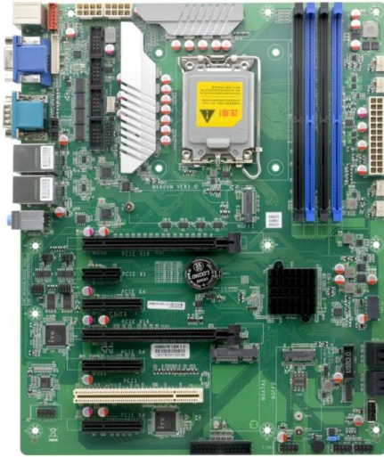
W680VM VER:1.0 主板正面图